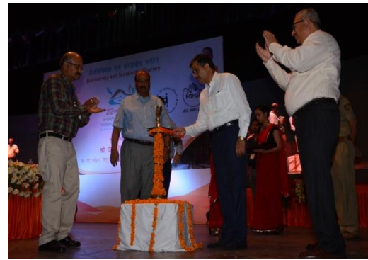
Lighting of Lamp by the Dignitaries at Dais