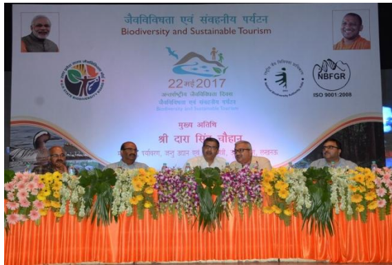
View of Dais