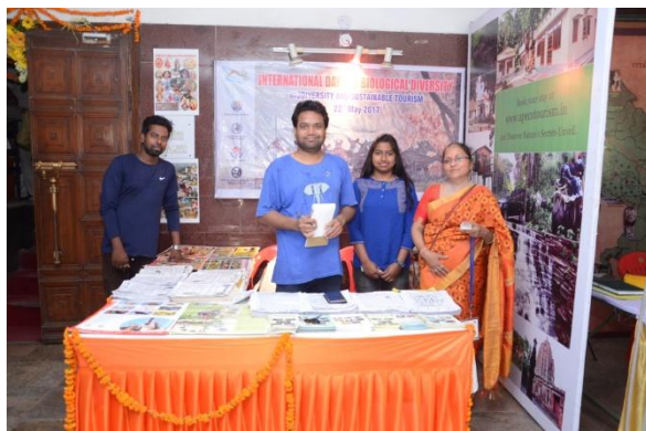
Glimpse of Awareness Stall