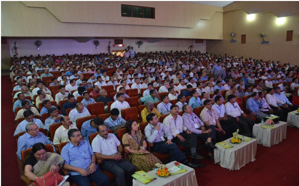
A General View of Audience