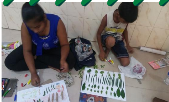
Participants of poster competition