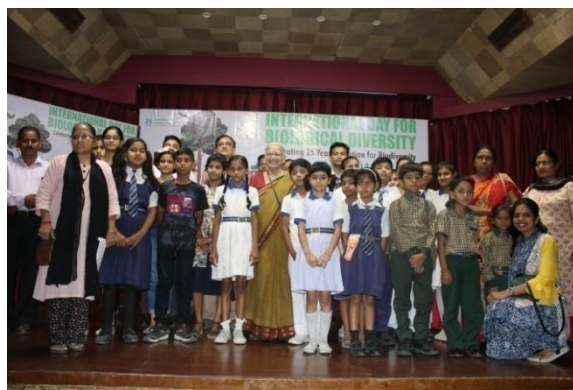
Group photo of all winners and Volunteers

On the occasion of International Day for Biological Diversity on 22 nd May, 2018, the first and second prize winners of events organized at Regional Science City, Lucknow were felicitated by Hon'ble Forest & Environment Minister Shri Dara Singh Chauhan.