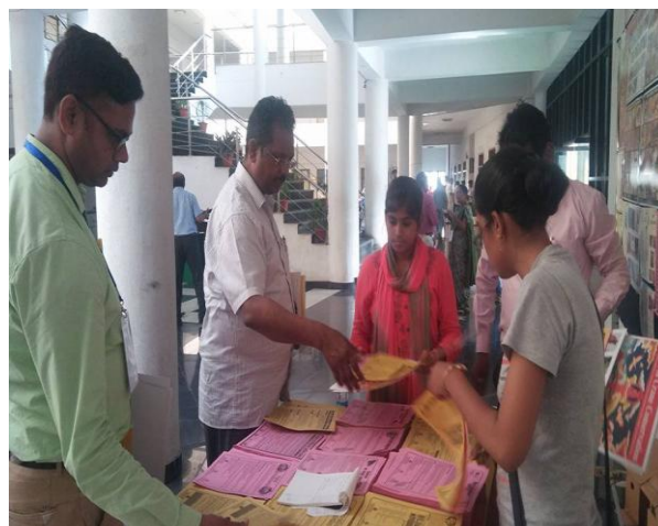
View of Awareness Stall and Exhibit