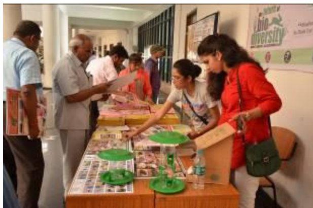
Glimpse of Awareness Stall