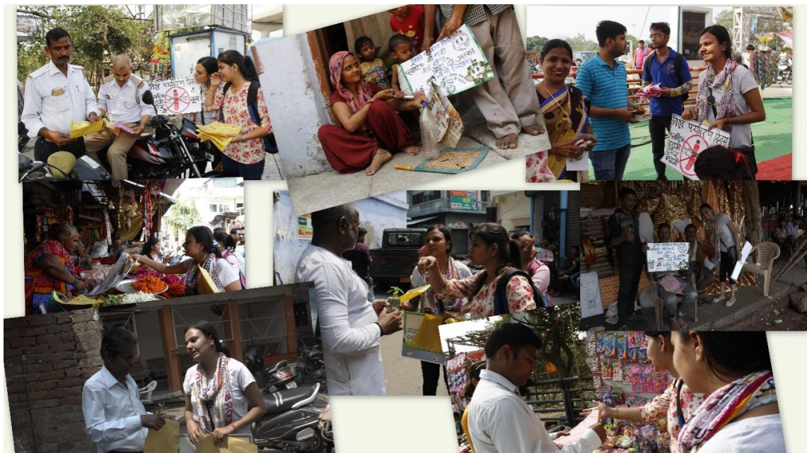
Fig.4: Mass awareness by the volunteers to reuse or refuse of plastic products

Number of handmade paper bags were distributed to the public and appealed to stop the use of plastic bags. Local people were made aware regarding Plastic Pollution and Environment degradation including students, common people and vendors etc.