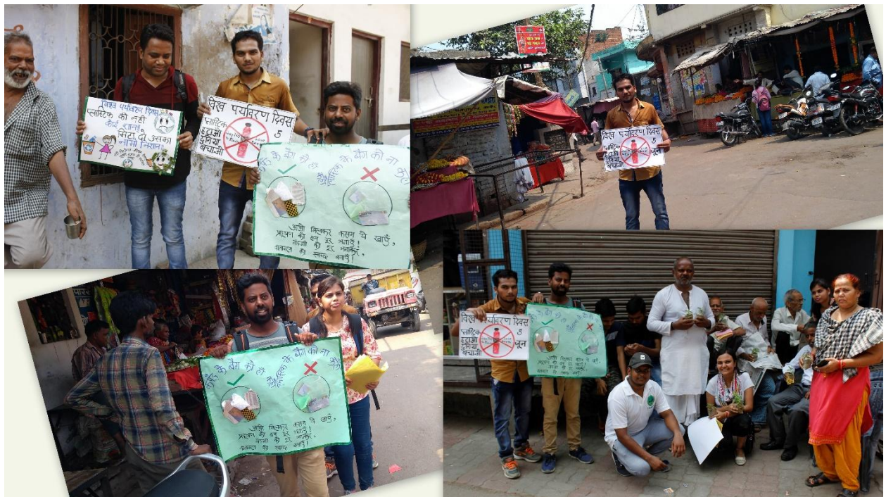
Fig.6: Street Awareness: Say No to Polythene or Plastic