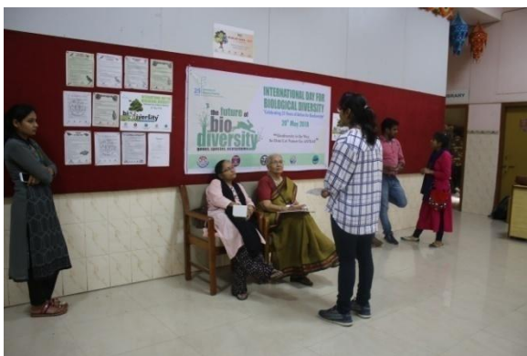
Participant of Extempore competition