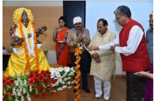
Lighting of Lamp by the Dignitaries at Dais