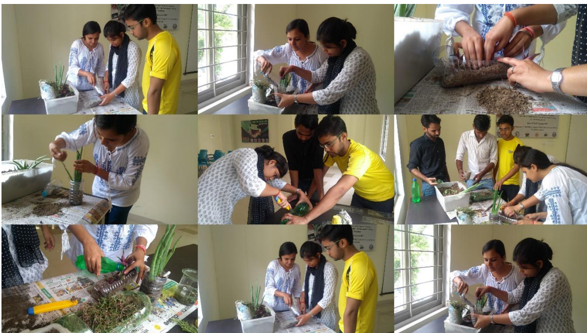
Fig.2: Preparation of flower pots from plastic waste bottles