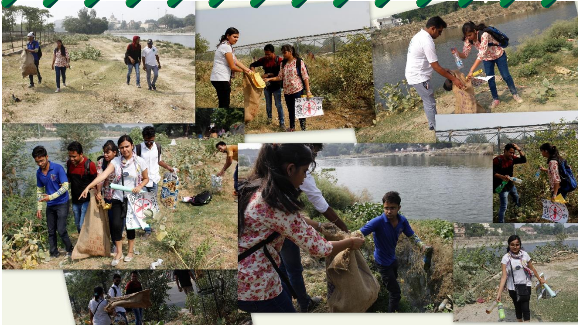
Fig.1: Volunteers collecting the plastic bottles from the selected area of campaign