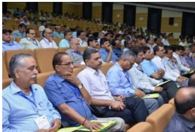
A General View of Audience