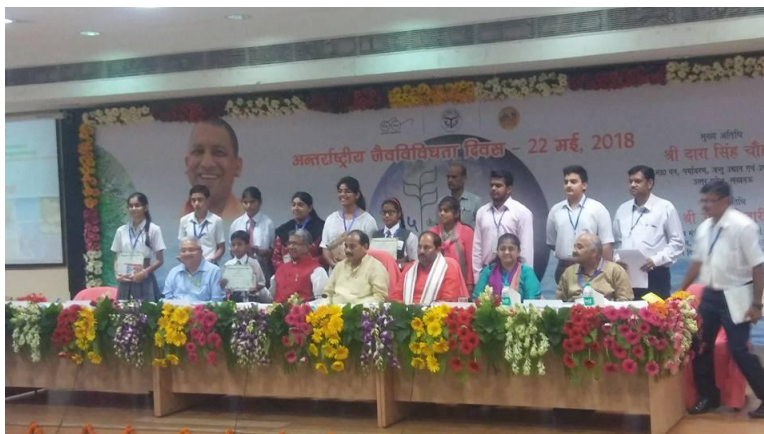
Felicitation of winners of different competitions by Hon'ble Forest & Environment Minister Shri Dara Singh Chahuan