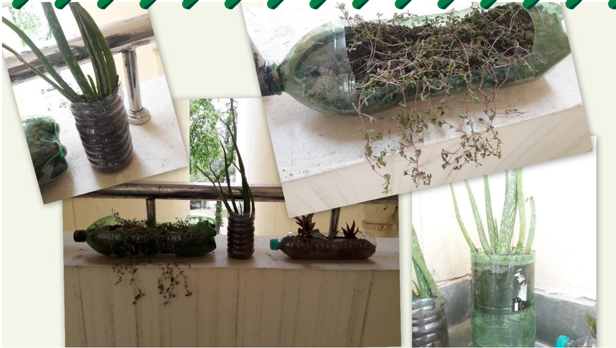
Fig.3: Reuse of plastic bottles for planting purpose