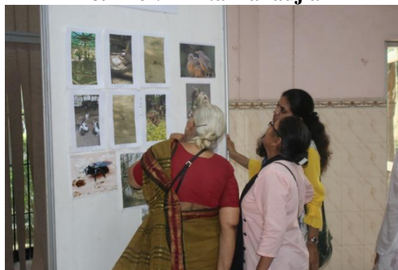
Judgement of Photography competition