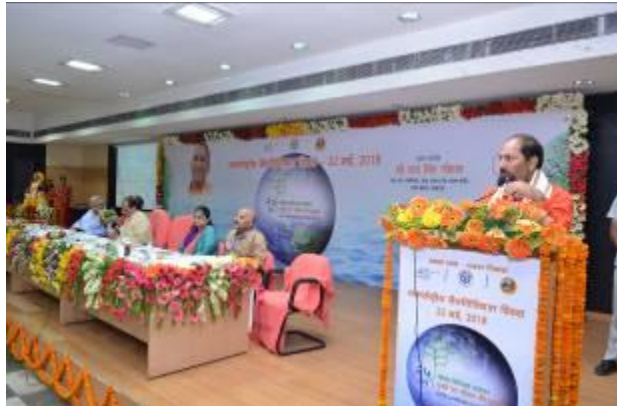
View of Dais